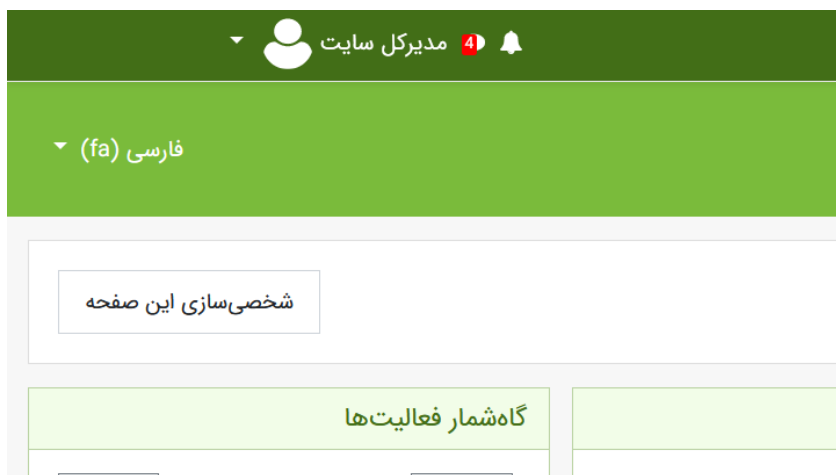
(تصویر شماره ۲)

در صورتی که به هر دلیل بخش کلاسیگرام را در صفحه اول مشاهده نمی‌کنید می‌توانید با کلیک بر روی دکمه شخصی سازی این صفحه (تصویر شماره ۲) و بعد از آن اضافه کردن یک بلوک (تصویر شماره ۳) ، بلوک Adobe Connect Report (تصویر شماره ۴) را به صفحه خود اضافه نمایید. بعد از اضافه شدن لازم است گزینه اتمام شخصی سازی را انتخاب کنید.